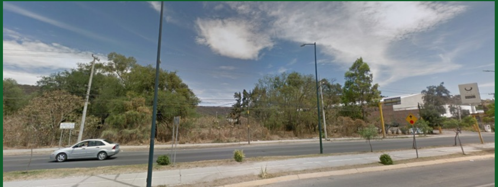
TERRENO EN JUAN JOSÉ TORRES LANDA #4950 SALIDA SAN FRANCISCO DEL RINCÓN